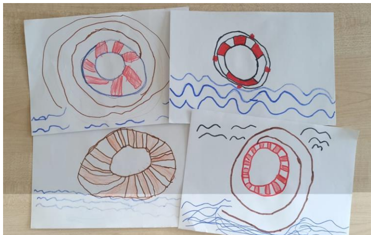
Делали аппликацию «Правила поведения на воде»